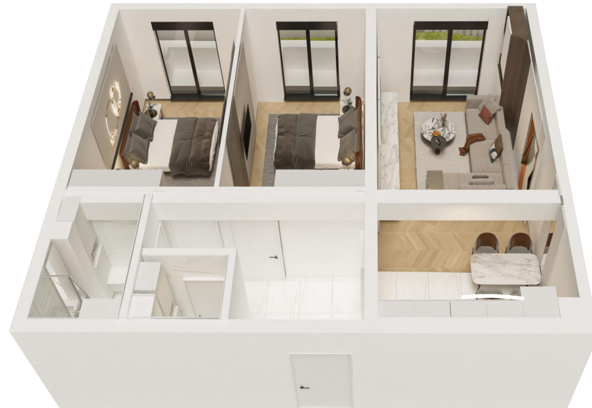
3D MODEL STANA